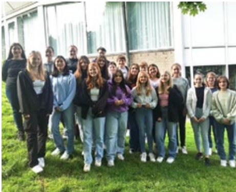
Unser Konfliktlotsenteam im Schuljahr 2023/2024