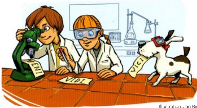
Illustration: Jan Birtakies (C.C.Buchner)