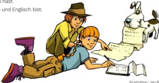
Illustration: Jan Bintakies (C.C.Buchner)