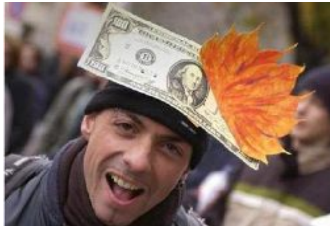
Jugend und Geld