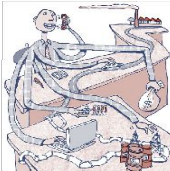
Das Centro und die Bottroper Wirtschaft