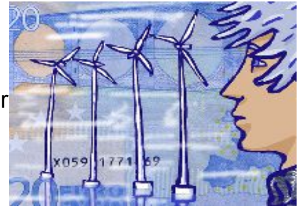
Tourismus im Revier