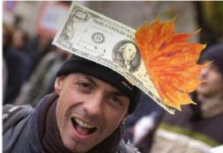
Jugend und Geld